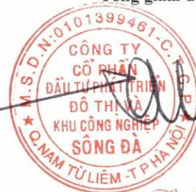
Trần Việt Dũng